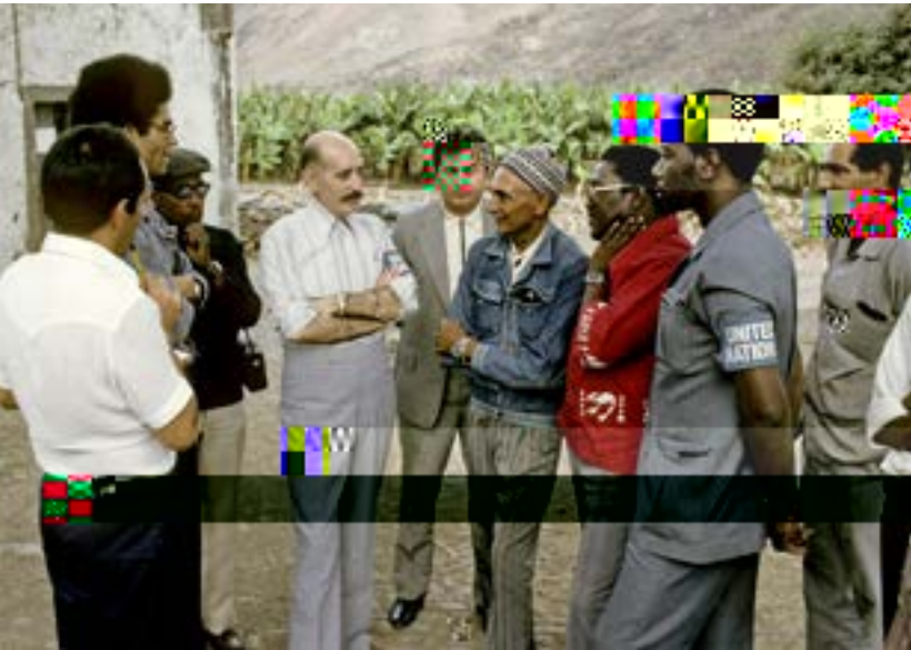
PRAIA, ISLA DE SANTIAGO, FEBRERO DE 1975: TEI C-24 visitó Cabo Verde por invitación del Gobierno de Portugal y el movimiento por la liberación del territorio, el Partido Africano de la Independencia de Guinea y Cabo Verde (PAIGC).

La Nac U. a a ac a a a a b ac TNA. La A a b a G a, a c a a Nac