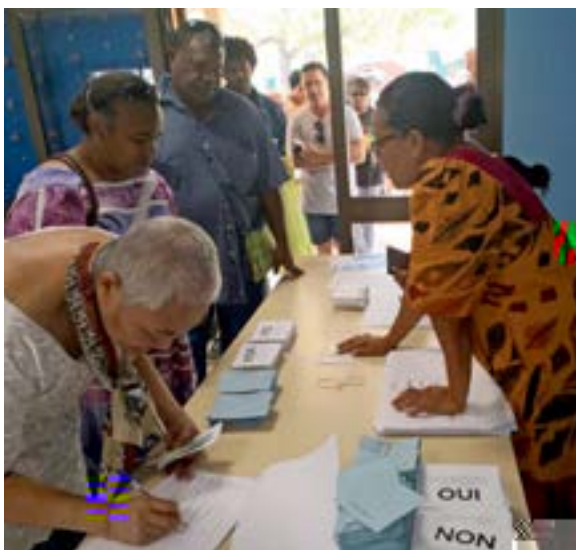
NUNEA, NUEVA CALEDONIA, NOVIEMBRE DE 2018: Una mesa de votación en Numea, Nueva Caledonia, durante el primer referéndum de libre determinación.

c a b a a . c a , c c ca 57 % y c a acc a a a b a a . c a a . a a 43 % a . a y . E Ac a c b a a c a ac ca . a 2020 2022. E ca a c . c a c a a , a a . y - c a a a a a a a . ac c a a . E C-24 y . a a a N ya Ca a 2014 2018 a c . c a ac a a . 2018.